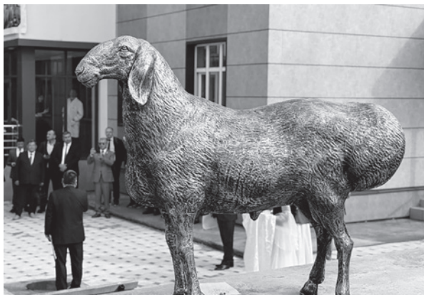
кой өстүрүүнүн алдыңкы технологиялары менен таанышты.

Конференциянын жүрүшүндө асыл тукум чарбага экскурсия уюштурулуп, катышуучулар